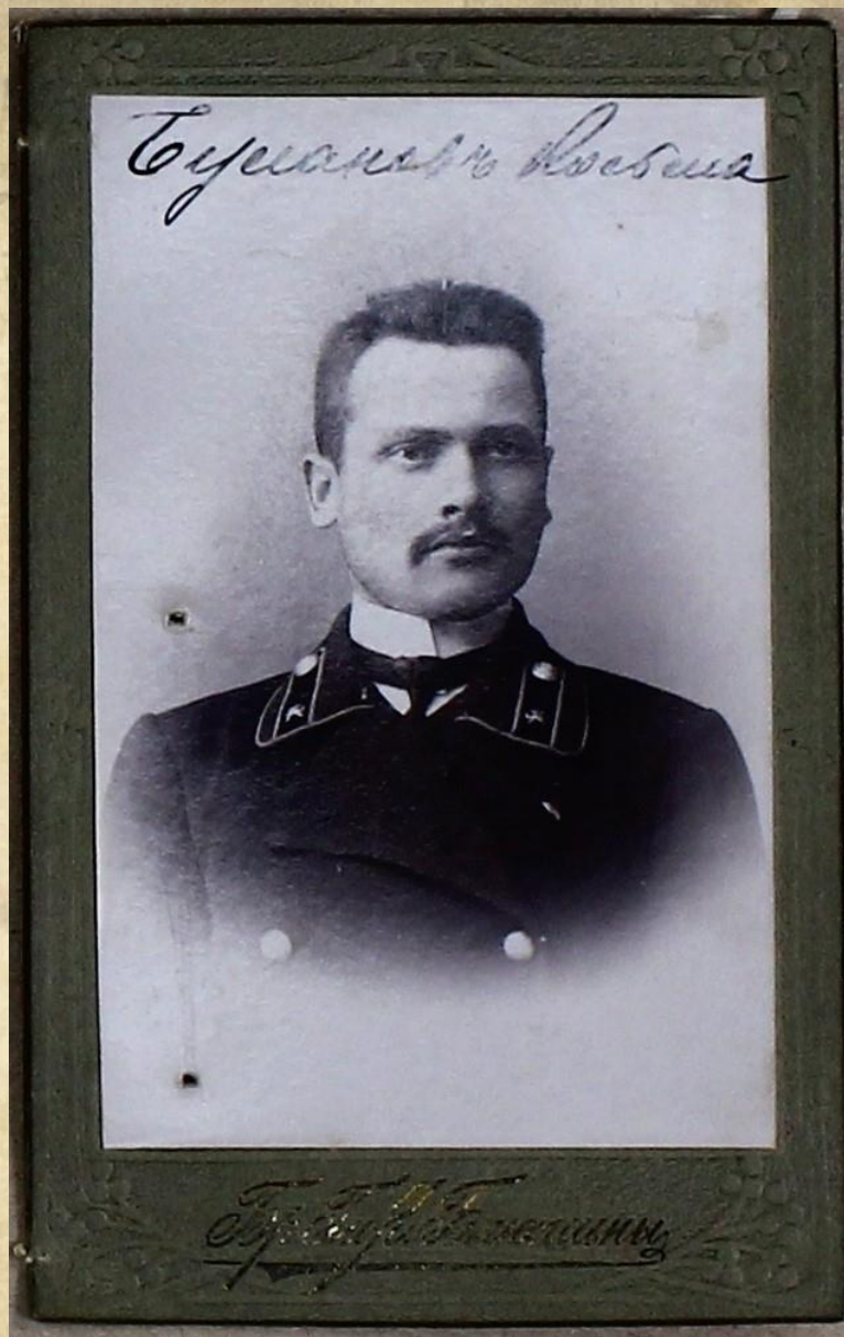
Фото Буланова К.П. ГАСО. Ф. 8. Оп. 2. Д. 1109. Л. 21а.