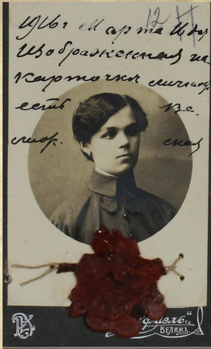
Фото Сухоруковой М.М. ГАСО. Ф. 8. Оп. 3. Д. 3295. Л. 12.